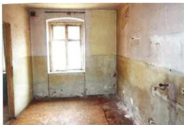
Widok fragmentu kuchni.