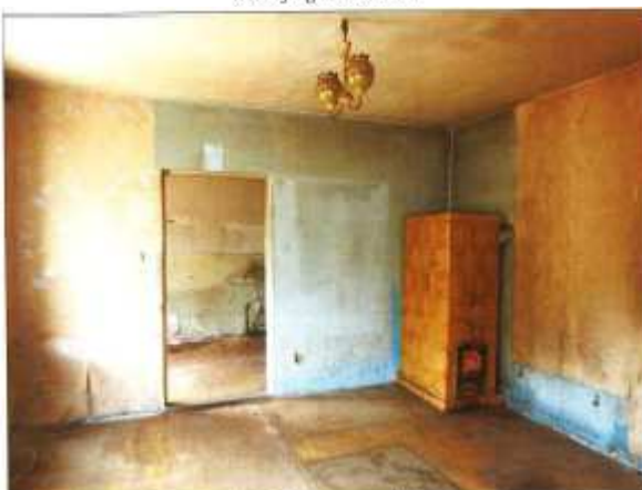
Widok fragmentu pokoju.