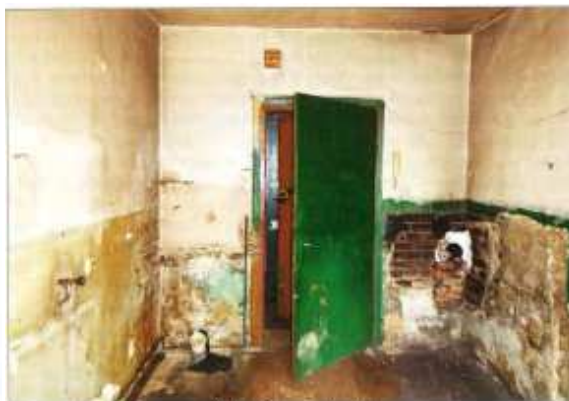
Widok fragmentu kuchni.