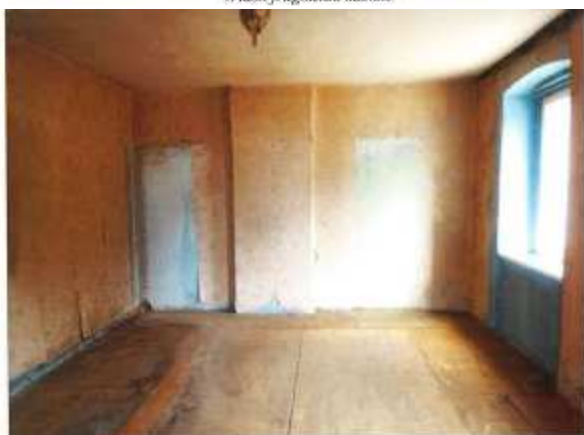
Widok fragmentu pokoju.