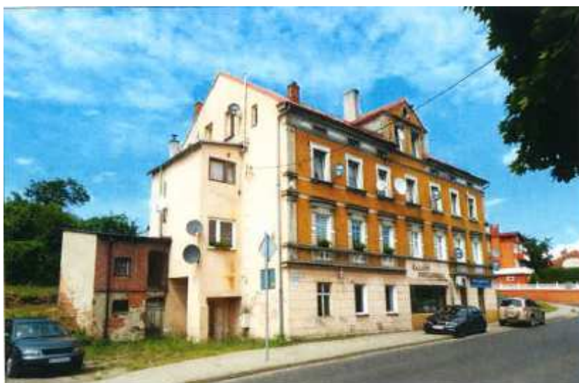
Widok elewacji frontowej – ul. Łużycka nr 9,

na sprzedaż lokalu mieszkalnego Nr 9, znajdującego się w budynku położonym w Lubaniu przy ul. Łużyckiej 9 wraz z udziałem we współwłasności nieruchomości gruntowej (działka nr 36, AM 2, Obręb III o powierzchni 217 m 2 , JG1L/00026253/6)